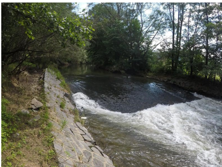
Stavba vakového jezu nebude realizována.