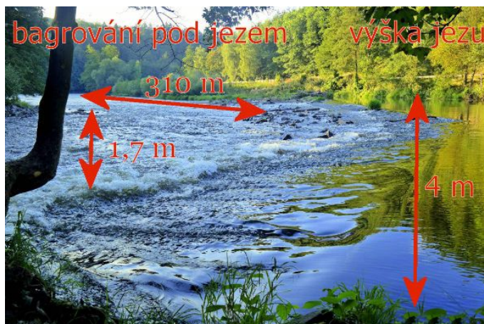
V Dubině má být vybudován 4 m vysoký a nebezpečný jez spojený s bagrováním toku